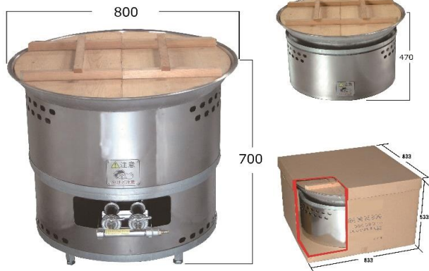
KFH-80 (平釜タイプ) 総重量: 約40.2kg