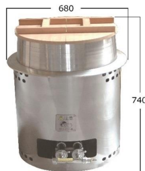
KFE-80 (エコミータイプ) 総重量: 約26.8kg