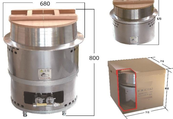
KWH-54 (羽釜タイプ) 総重量: 約37.3kg