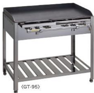
テーブル式 写真はGT-95

※接続 強化ホースジョイント1/2 ※接続 ホースエンド仕様の場合はご指定下さい。